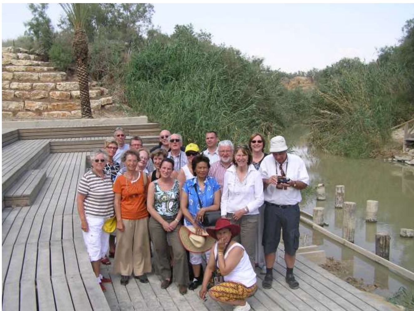
gezamenlijke parochies Venray: Grote Kerk en Paterskerk